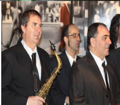
Projeto Inscrito na Lei Rouanet