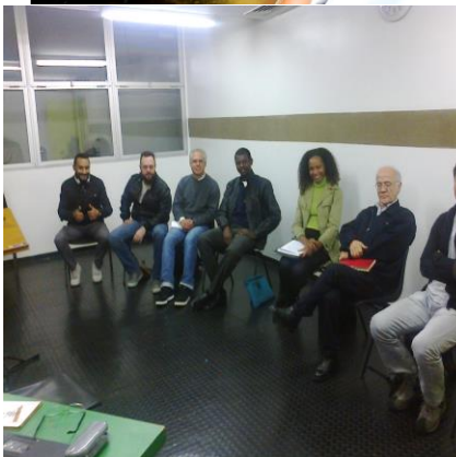
A Música como Treinamento Empresarial.